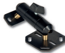
RSE.00500 RSE Rückfahrmonitor Halterung Ball-Mount